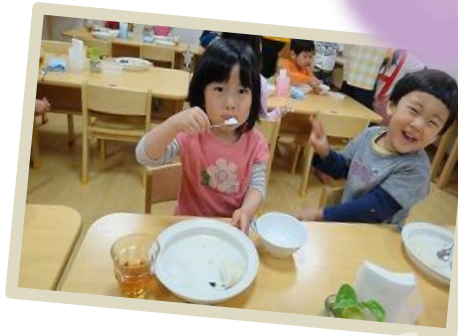
主体的に 育つ保育