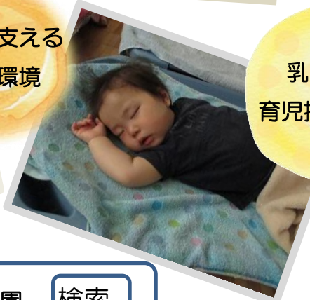
乳児期は 育児担当保育