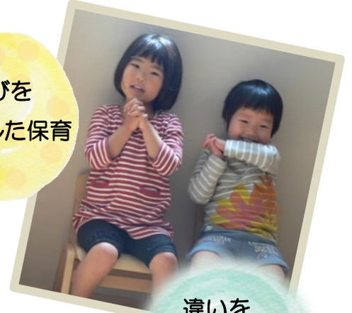
違いを 認め合う保育