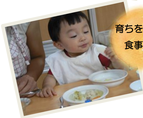
育ちを支える 食事環境