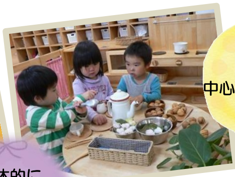
遊びを 中心とした保育