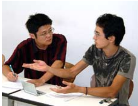
共に出席し始めました。

てくれます。学校の活動に参加しているうちに、本当の愛の味を考えるようになりまし。それは自らを犠牲にし、自らの利益を求めず、人のために考