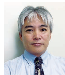
清教学園高等学校 宗教主事 (元東京YMCA野尻中高 キャンプチャブレン)

でしょうか。そして時が満ち、出産に劣悪な環境しか与えられなかった中、彼らは羊飼いや異国の学者の祝福を受けます。それは困難な旅を乗り越えて、御子の誕生を祝い、喜びを分かち合う友の交わりでした。私たちはコロナ禍で日常が制限される一年を過ごしました。そのような中であって、救い主の誕生を祝うと共に、「兄弟(友)が共に座っている」そのことを心から喜び合えるクリスマスを迎えたいものです。