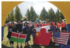
いつあひがしわーど (東YMCAリーダー会の皆様)

先月号(11月号)の3面「第21回 大阪YMCAインターナショナル・チャリティラン2015」にて掲載された写真とキャプションに誤りがありました。ここに訂正するとともに、謹んでお詫び申し上げます。