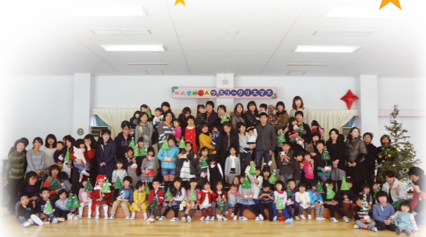
北摂YMCAファミリークリスマス

12月を迎え、巷では、ジングルベルの音が聞こえ出しています。YMCAでは、地域や世界の課題解決に向けて、特に、困難な状況にある人々に寄り添う活動や地域を豊かにする活動の支援金を募るために、「クリスマス献金キャンペーン」(11月～翌年1月までの3ヶ月間)を実施しています。 具体的なプログラム活動としては、地域の子どもたちやファミリー、青少年のための居場所づくり、児童養護施設に入所している子どもたちの招待キャンプ、視覚障がいを持つ人々のための外出補助、次世代を担う国内外のユースを育成するための国際協力(ミャンマーをはじめとする東アジア諸国ほか)と青少年育成支援(海外学生の交流受け入れほか)、東日本大震災飲料水支援活動などのために用いられます。 みなさまの愛が、YMCAのプログラム活動を通して、地域に、世界に、そして、地球全体にひろがります。どうぞご協力をお願いします。