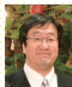
日本基督教団 大阪教会 牧師