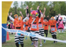
ワイ de さかい (堺YMCAリーダーOBの皆様)