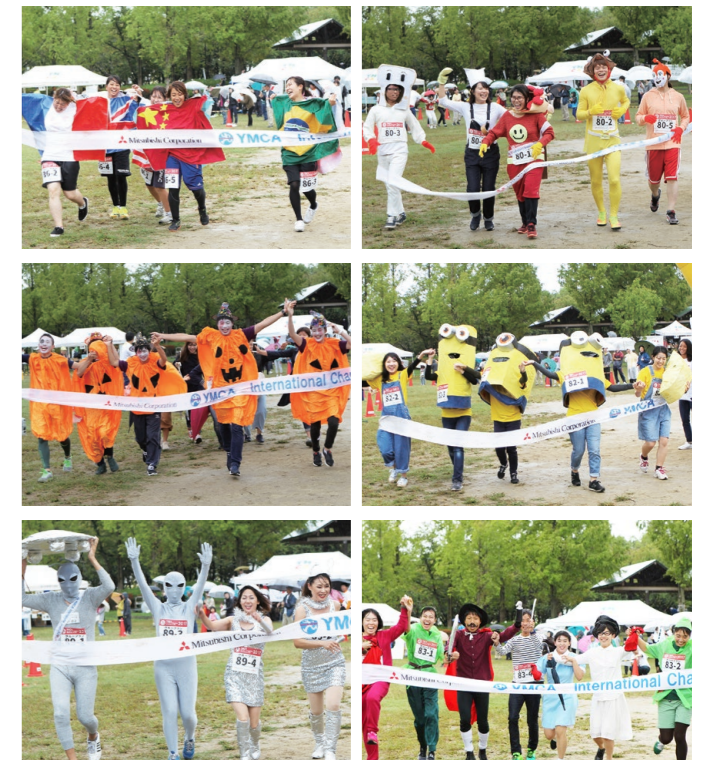
仲里ボクシングジムの皆さんが たすきリレー連覇達成! ワイドさかい(堺YMCAリーダーOB)チームが コスチューム賞を前大会に続き受賞!