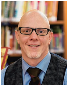
大阪YMCA インターナショナルスクール 幼稚園・小学部 校長