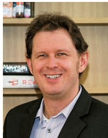
大阪YMCA インターナショナルスクール 中学部 校長