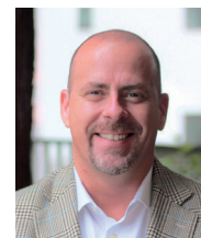
大阪府立 水都国際中学校・高等学校 副校長

このような豊かなリソースを活用し、これからの社会をリードしていける有為な人材がYMCAから巣立っていってくれることを心から願っています。