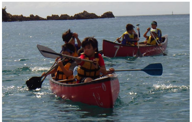
（カヌー：4～6人乗りの船です）