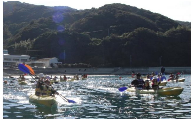
（カヤック：2～3人乗りの船です）