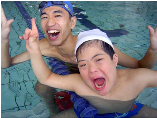
南YMCAエンジェルスイミングより