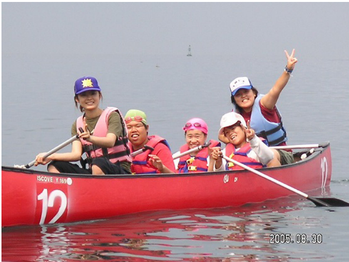
堺YMCA どんぐりマリンキャンプより