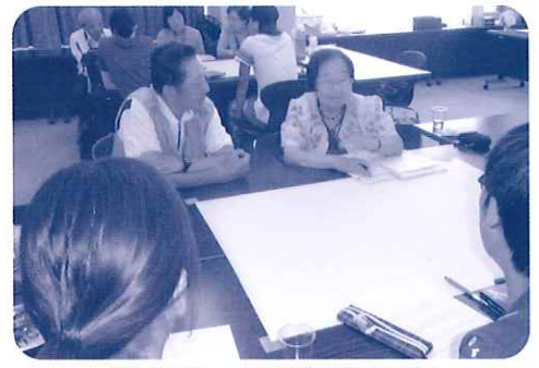
第2回のシニアと高校生の交流の様子